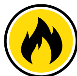
Fire Systems, Tests & Inspections