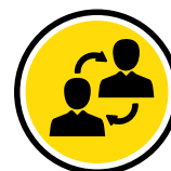
Consulting & Risk Management