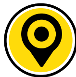
Asset Tracking & Analytics