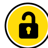
Security Standards Development