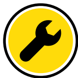
Service Plans & Preventative Maintenance