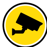
Video Surveillance (CCTV)